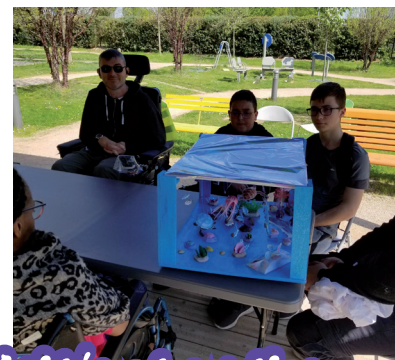
Aperçu des activités et sorties