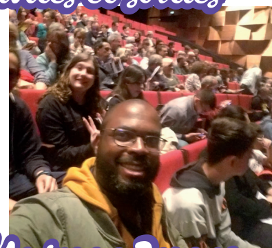
proposées par l'Antenne Jeunes