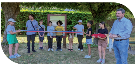
Une nouvelle boîte à livres à Cesson