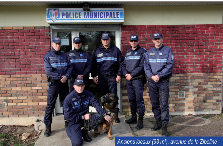
Anciens locaux (93 m 2 ), avenue de la Zibeline