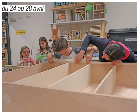
du 24 au 28 avril