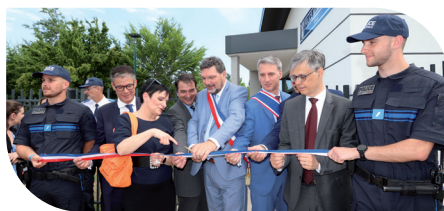
Inauguration du nouveau poste de Police Municipale