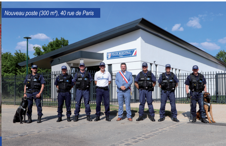
Nouveau poste (300 m 2 ), 40 rue de Paris