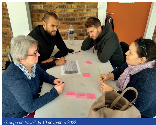
Groupe de travail du 19 novembre 2022

De quoi prendre soin de nos petits cessonçais !