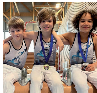
Photo ci-contre : Gymnastes sénartais engagés dans la catégorie Régionale 10 ans

Ces gymnastes ont d'ores et déjà rendez-vous le week-end prochain au Blanc-Mesnil pour les concours en équipes. Félicitations à eux !