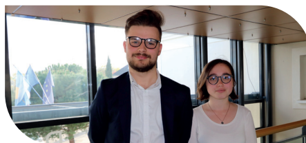
Conseil régional des Jeunes