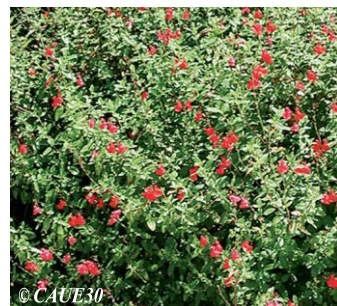
© CAUE30 Salvia microphylla raison :