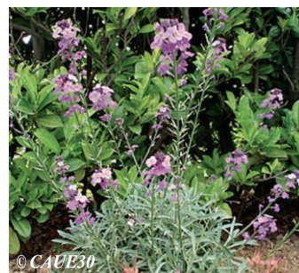
Giroflée vivace Erysimum 'Bowles Mauve' Hauteur : 60 cm Sol : Drainé Floraison : Printemps