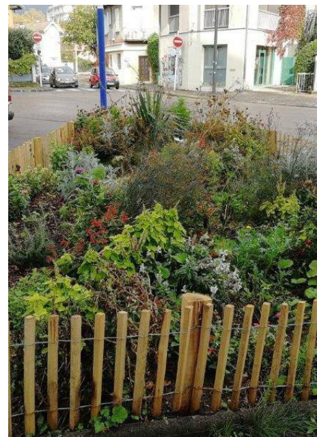
Une palette végétale variée et colorée. Le taille du végétal est adaptée à l'espace.