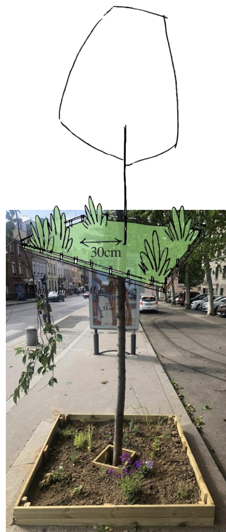
Plantation en pied d'arbre dans le respect de l'arbre existant. Exemple Ville de Lyon 69