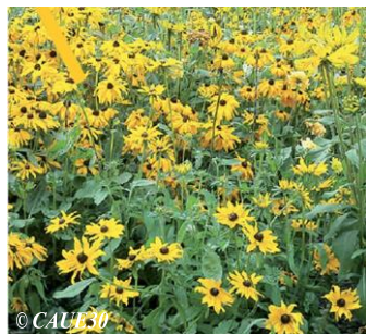
Rudbeckie Rudbeckia fulgida Hauteur : 1m Sol : Ordinaire, bien drainé Floraison : Juin à septembre