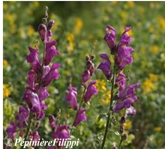
Gueule de loup Antirrhinum majus Hauteur : 15 à 120 cm Sol : Plutôt riche, drainé Floraison : Juin à septembre