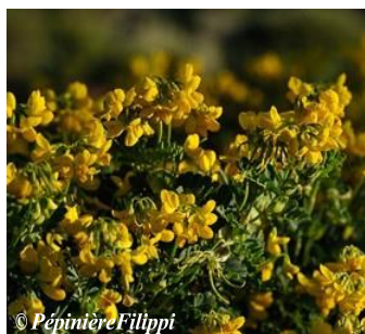
Coronille glauque Coronilla valentina Hauteur : 80 cm Sol : Pauvre, bi Floraison : Mars à mai