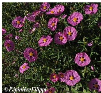
Ciste Cistus x purpureus Hauteur : 1m Sol : Plutôt pauvre Floraison : Printemps