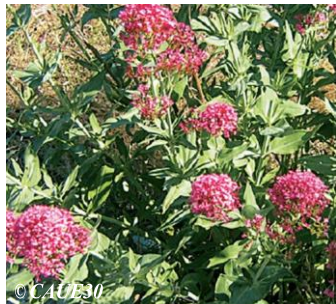
Valériane rouge Centranthus ruber Hauteur : 60 à 100 cm Sol : Ordinaire, voire pauvre Floraison : Mai à septembre