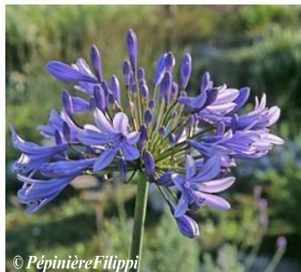
© PépinièreFilippi Agapanthe Agapanthus Hauteur : 60 à 100 cm Sol : Ordinaire, bien drainé Floraison : Juin à juillet