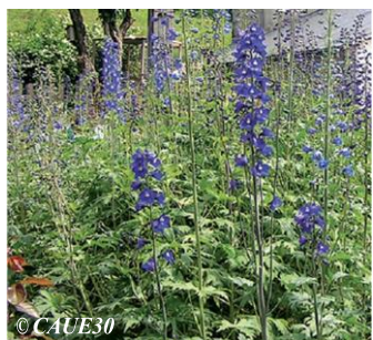
© CAUE30 Pied d'alouette Delphinium elatum Hauteur : 1m (en fleurs) Sol : Floraison : Fin d'été