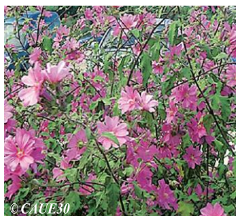
Lavatère maritime Lavatera maritima Hauteur : 50 à 140 cm Sol : Ordinaire Floraison : Juillet à octobre