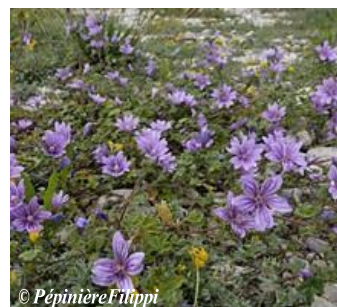
Mauve sylvestre Malva sylvestris Hauteur : 20 à 50 cm Sol : Ordinaire Floraison : Mai à septembre