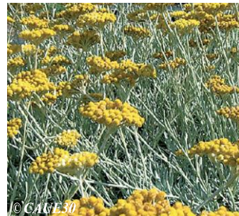
© CAUE30 Cinénaire maritime Cineraria maritima Hauteur : 50 à 60 cm Sol : Ordinaire Floraison : Mai à juillet