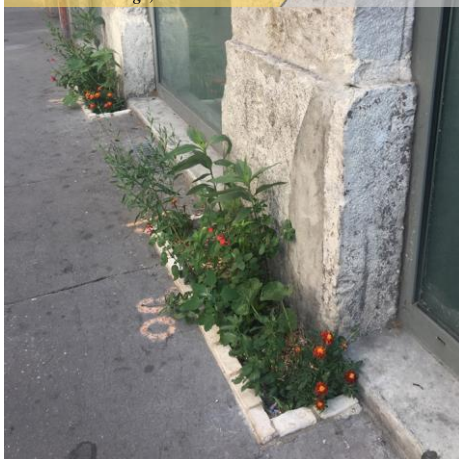
Microplantations sur le trottoir qui ne l'encombrent Exemple Ville de Lyon 69