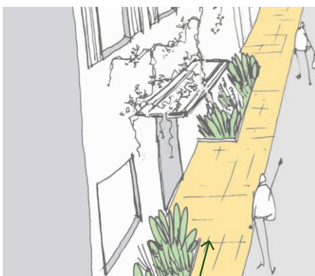
La végétalisation de façade fait l'objet d'une convention d'occupation temporaire du domaine public