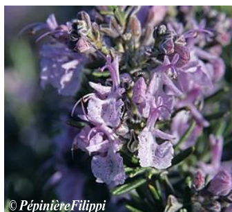
Romarin Rosmarinus officinalis Hauteur : 1 à 1,5 m Sol : Ordinaire