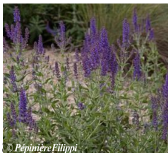
Salvia amplexicaule F l o