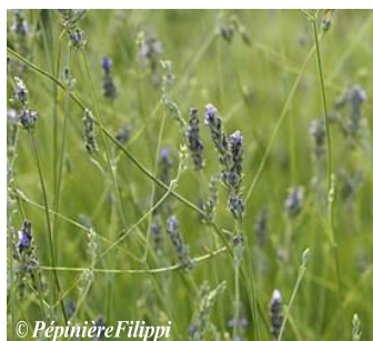
Lavande à grandes feuilles Lavandula latifolia Hauteur : 20 à 80 cm Sol : Ordinaire, bien drainé Floraison : Eté