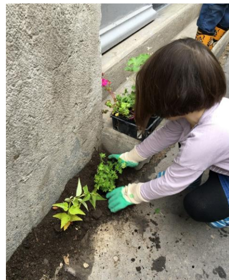
Un espace prêt à jardiner planté par les bénéficiaires du permis. Exemple Ville de Lyon, 69

Je soussigné(e)/nous soussigné(es) XXX atteste/attestons avoir pris connaissance du guide pratique et de la chartre d'entretien des jardins de rues et consens/consentons à appliquer les conseils qui y sont énoncés.