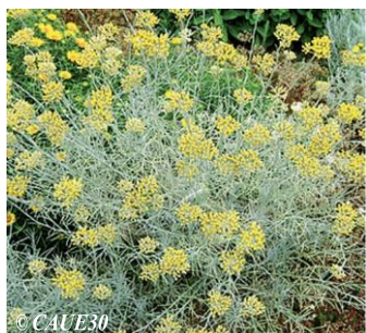
© CAUE30 Immortelle commune Helichrysum stoechas Hauteur : 50 cm Sol : Ordinaire Floraison : Juin à octobre