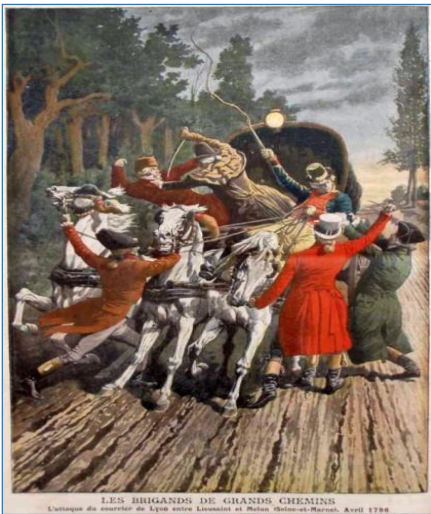
Illustration parue dans le Petit Journal en 1907.