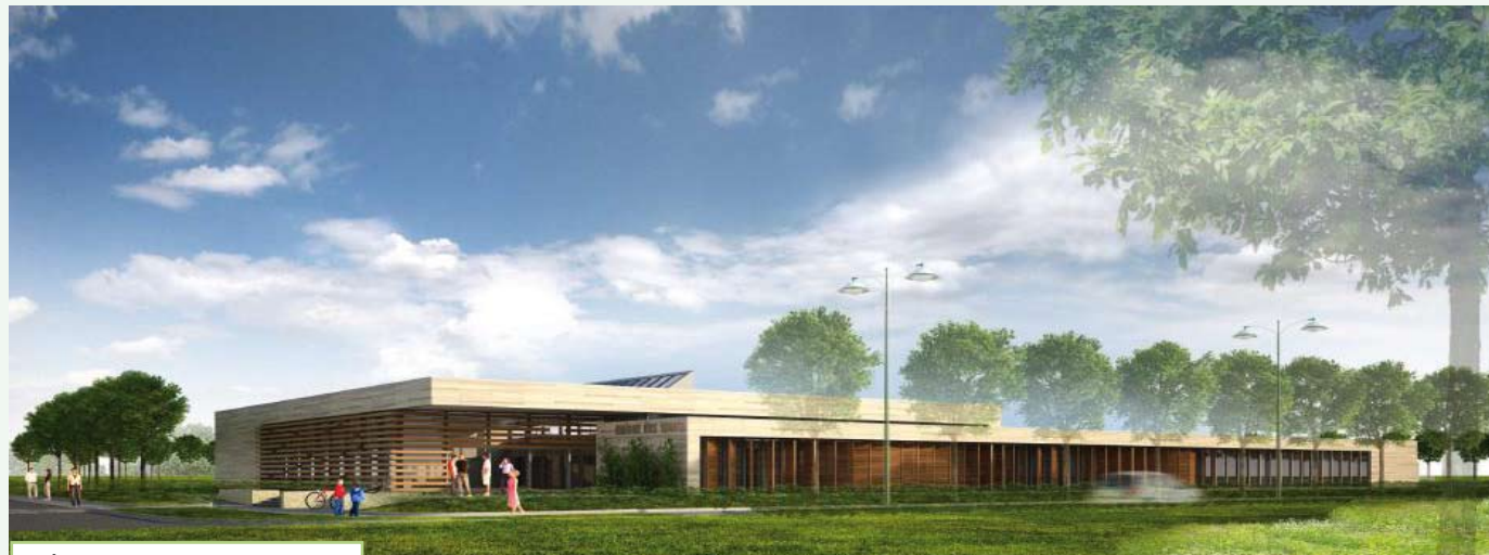
Présentation par le Cabinet SL-Archi du projet final : Maison des Sports à Cesson

Ce nouvel équipement d'un coût global H.T de 2 373 550 € sera cofinancé par la Région et le Département à hauteur de 42 %, le solde étant à la charge du S.I.S. Les travaux sont prévus dès mars 2011 pour une ouverture prévisionnelle en septembre 2012.