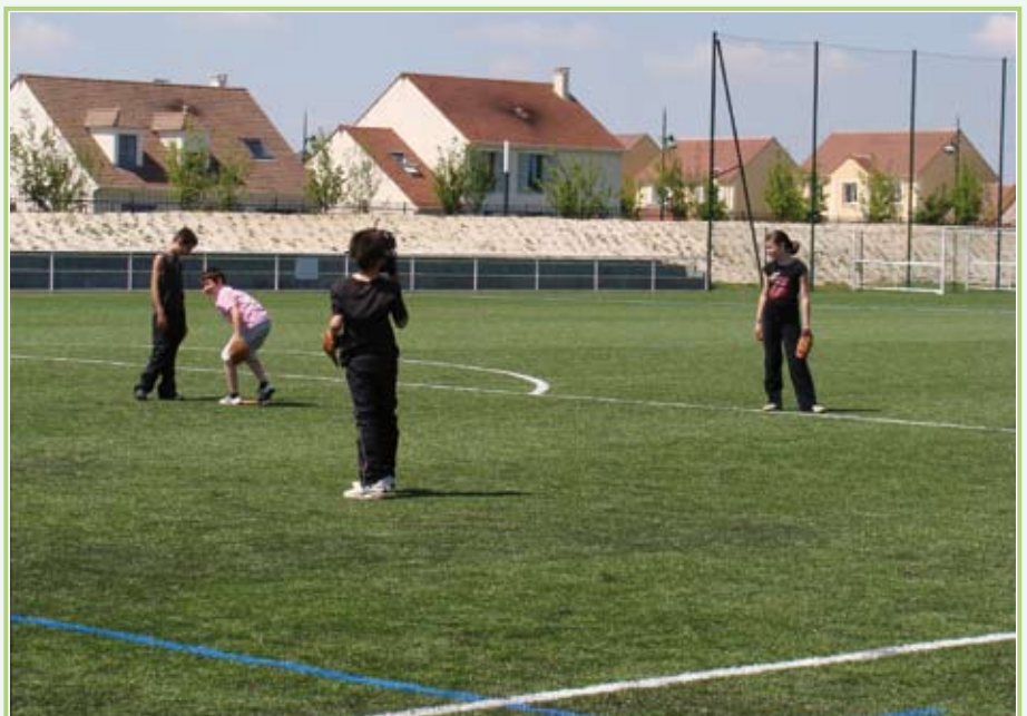
Le terrain synthétique sera inauguré le jeudi 25 novembre en présence des élus de la Région, du Département, et des deux communes.

Fédération Française de Football. La participation du S.I.S. est de 415 000 € financée par un emprunt d'une durée de 10 ans.