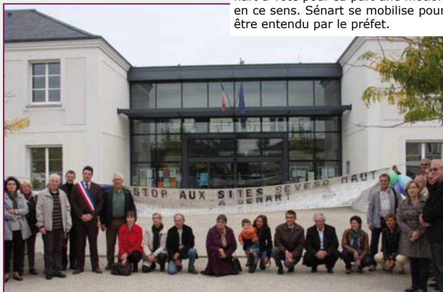
Élus, associations et riverains se sont mobilisés devant la mairie le 29 septembre dernier

Comme Cesson, les autres communes de la ville nouvelle de Sénart ont voté contre l'obtention de l'autorisation de Seveso seuil haut pour Norbert Dentressangle. Le comité syndical du San de Sénart a voté pour sa part une motion en ce sens. Sénart se mobilise pour être entendu par le préfet.