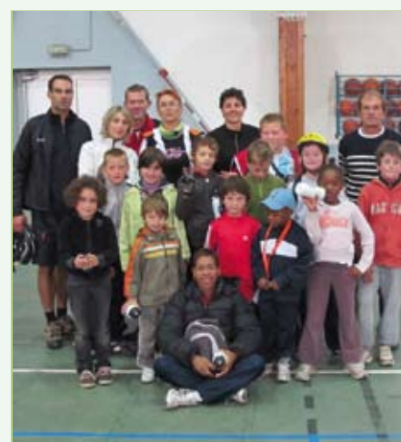
Élèves de l'école Jacques Prévert entourés de leur professeurs respectifs, lors de la participation à la 31 ème Randonnée du Balory

quant à la participation d'une douzaine d'enfants de l'école Jacques Prévert qui sur le thème éducatif du vélo ont arpenté les sous bois de la forêt de Rougeau. Comme quoi le vélo a de l'avenir !