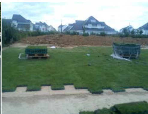
Parking engazonné École Jules Verne