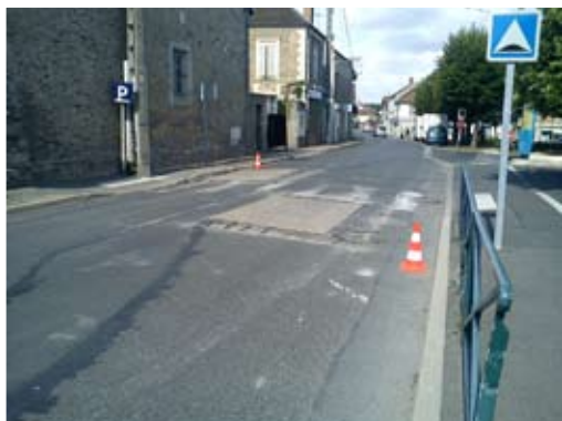
Ralentisseur avenue Charles Monier

Des travaux de voirie et d'aménagements urbains ont été effectués dans différents quartiers de la ville depuis le début de l'année . Voies routières, espaces piétons et équipements de sécurité sont l'objet d'une attention quotidienne. Près de 133 000 € ont ainsi été dépensés pour améliorer, sécuriser et aménager nos espaces urbains.