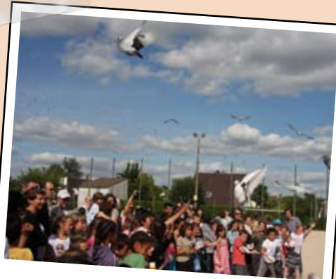
24 juin - Fête à l'école Paul Emile Victor