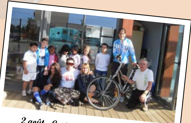
2 août - Centre de loisirs Jules Verne