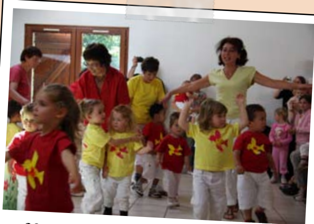
22 juin - Spectacle de la crèche familiale