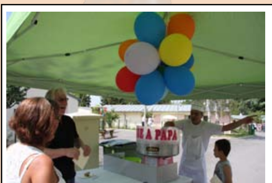
29 juin - Kermesse au Village d'Enfants