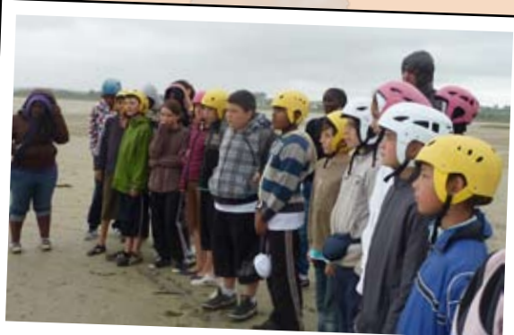
19 juillet - Séjour en Bretagne