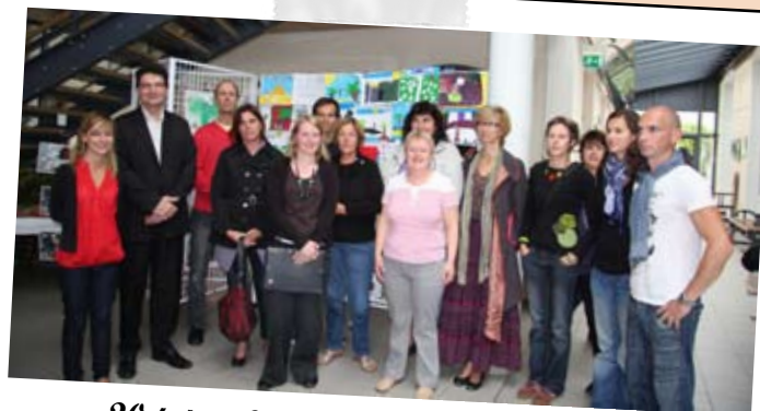
20 juin - Les écoles visitent l'exposition «Parcours vers l'art»