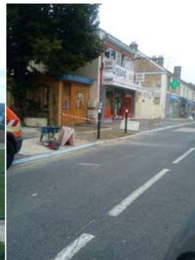
Passage piéton avenue Charles Monier