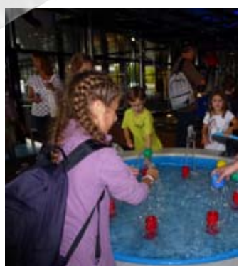
3 août - Centre de loisirs