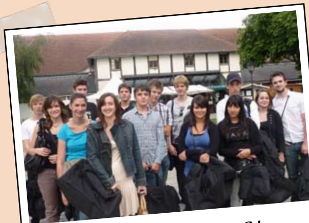
30 juin - Remise des «Sacs Ados»