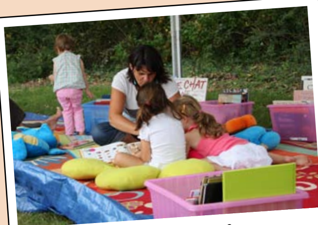
25 août - Caravane de Livres