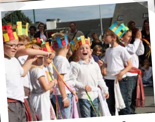
10 juin - Fête de l'école Jules Ferry