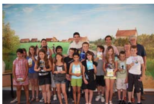
27 juin - Remise des livres aux classes de CM2