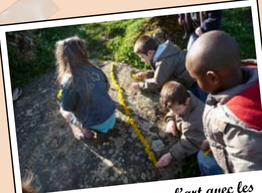
Juin - Parcours vers l'art avec les élèves de l'école Jacques Prévert