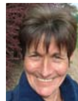
école Jules Ferry