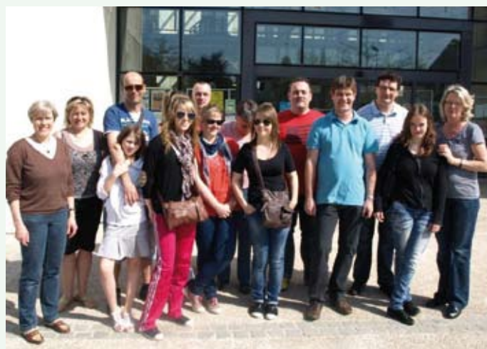
Jumelage roumain : départ le 10 avril dernier, devant la mairie, de 4 jeunes filles Cessonaises.

Pour la 3 ème fois, dans le cadre des échanges avec nos jumelages, des familles de Bivolarie ont reçu quatre jeunes Cessonaises.