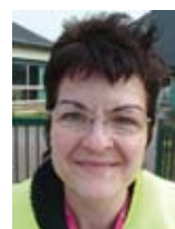
école Paul-Émile Victor

La Police municipale est constituée aujourd'hui de six policiers. Cinq agents de surveillance des points écoles complètent le dispositif policier. Leurs prérogatives concernent la sécurité des enfants aux entrées et à la sortie de tous les groupes scolaires.