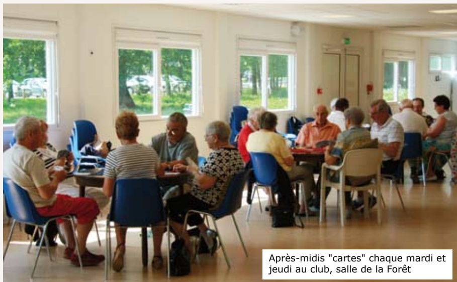
Après-midis "cartes" chaque mardi et jeudi au club, salle de la Forêt

Contact : Raymond Jobert à raymond.jobert@wanadoo.fr ou 01 60 63 14 49