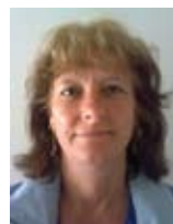
école Jean de la Fontaine