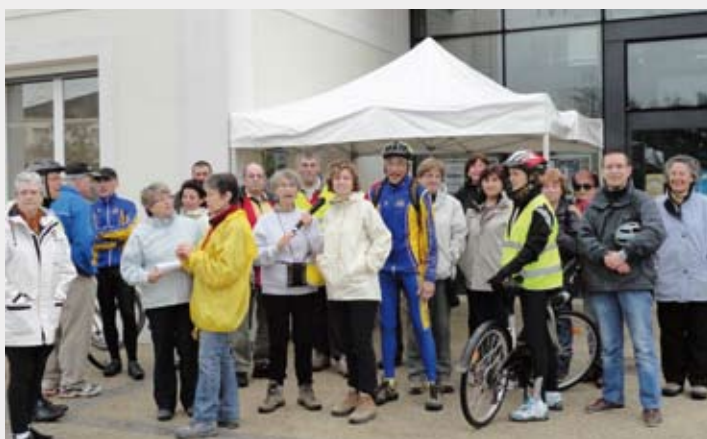
Randonnée à vélo ou à pied, travers la ville organisée le 3 avril dernier

Pour la 1 ère fois, en partenariat avec des associations, et plus particulièrement "Développement Durable, Notre Avenir" (DDNA), le conseil municipal a souhaité s'investir et promouvoir, à travers différentes actions, les principes du développement durable. Plusieurs animations ont été proposées ; l'occasion de sensibiliser la population (tous âges confondus) sur ces enjeux.