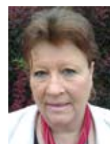
école Jacques Prévert