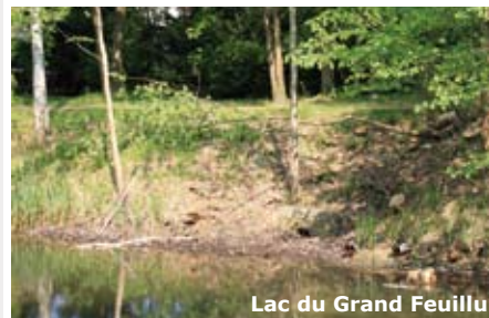
Lac du Grand Feuillu

En 2010, la commune n'a pas été en mesure d'inscrire au budget 2011, la réfection des berges de l'étang du grand Feuillu, acte préalable à un curage. Toutefois un travail important vient d'être achevé autour de cet étang.