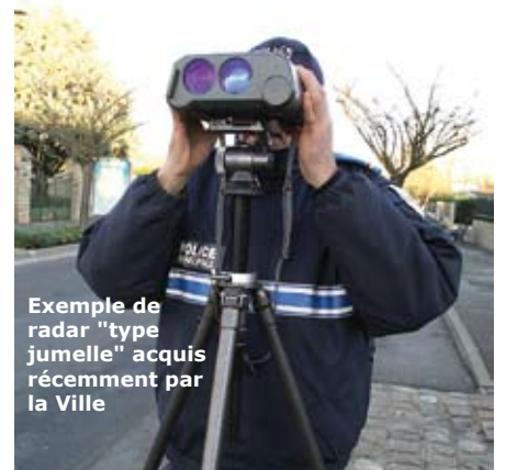
Exemple de radar "type jumelle" acquis récemment par la Ville

Les contrevenants seront interceptés, et les policiers municipaux les informeront de leur vitesse enregistrée.