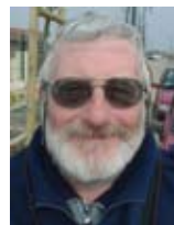
école Jules Verne