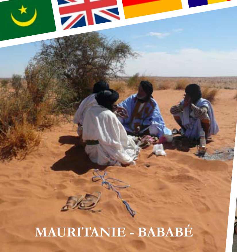
MAURITANIE - BABABÉ