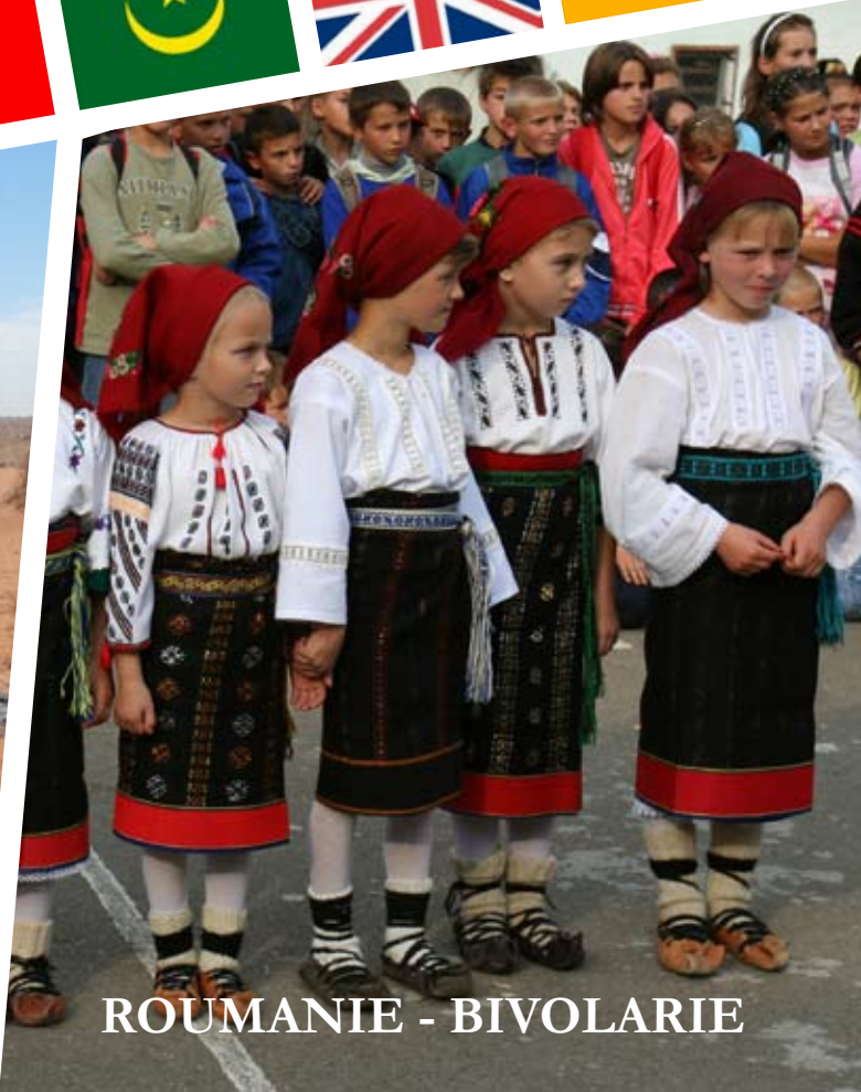
ROUMANIE - BIVOLARIE